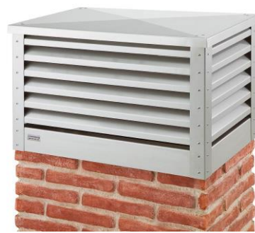
BLIND CHIMNEY CÚBICA