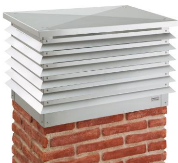
BLIND CHIMNEY MINIMAL